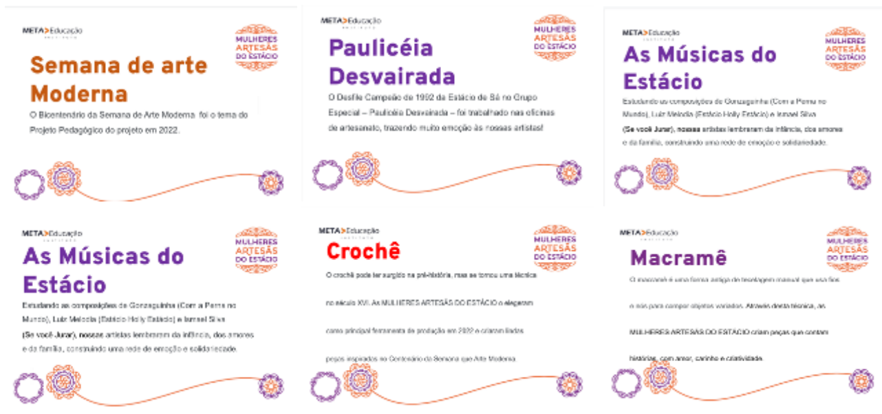
Peças explicativas sobre conteúdos do PPP trabalhados em 2022 e técnicas aprofundadas