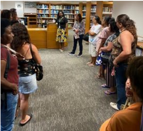
Artesãs são recebidas na biblioteca da empresa, e ...

Durante a visita à sede da organização, as artesãs visitaram a biblioteca do local e receberam o convite para serem cadastradas para retirar livros em forma de empréstimo. Elas adoraram a oportunidade.