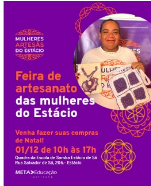
TEMPLATE DIVULGAÇÃO FEIRAS.