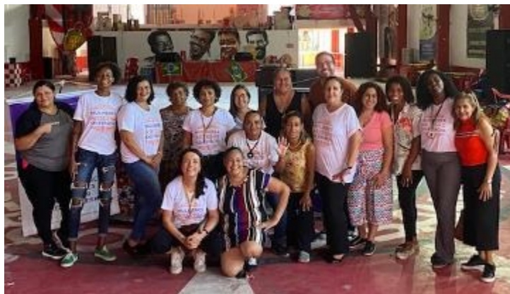
Parte das artesãs na Feira de encerramento do projeto na Escola de Samba Estácio de Sá