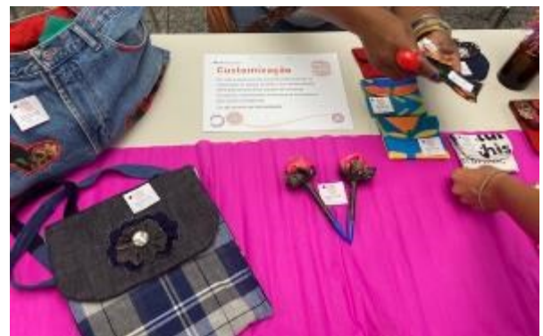
Algumas peças produzidas pelas Mulheres Artesãs do Estácio