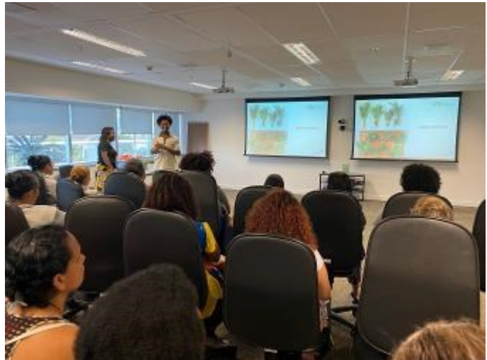
participaram de uma palestra sobre jardinagem