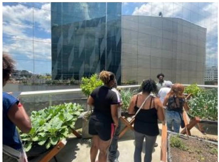
Ao final, todas ganharam uma muda de suculenta e visitaram a horta da empresa