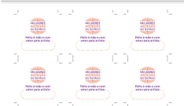
TAG DIVULGAÇÃO 45X45. MAIS DE 200 TIRAGENS.

O Instituto Meta Educação investiu nas peças de divulgação para as Feiras das Mulheres Artesãs. Desde o primeiro convite, no Circo Crescer e Viver, o Instituto ofereceu gratuitamente o material abaixo: